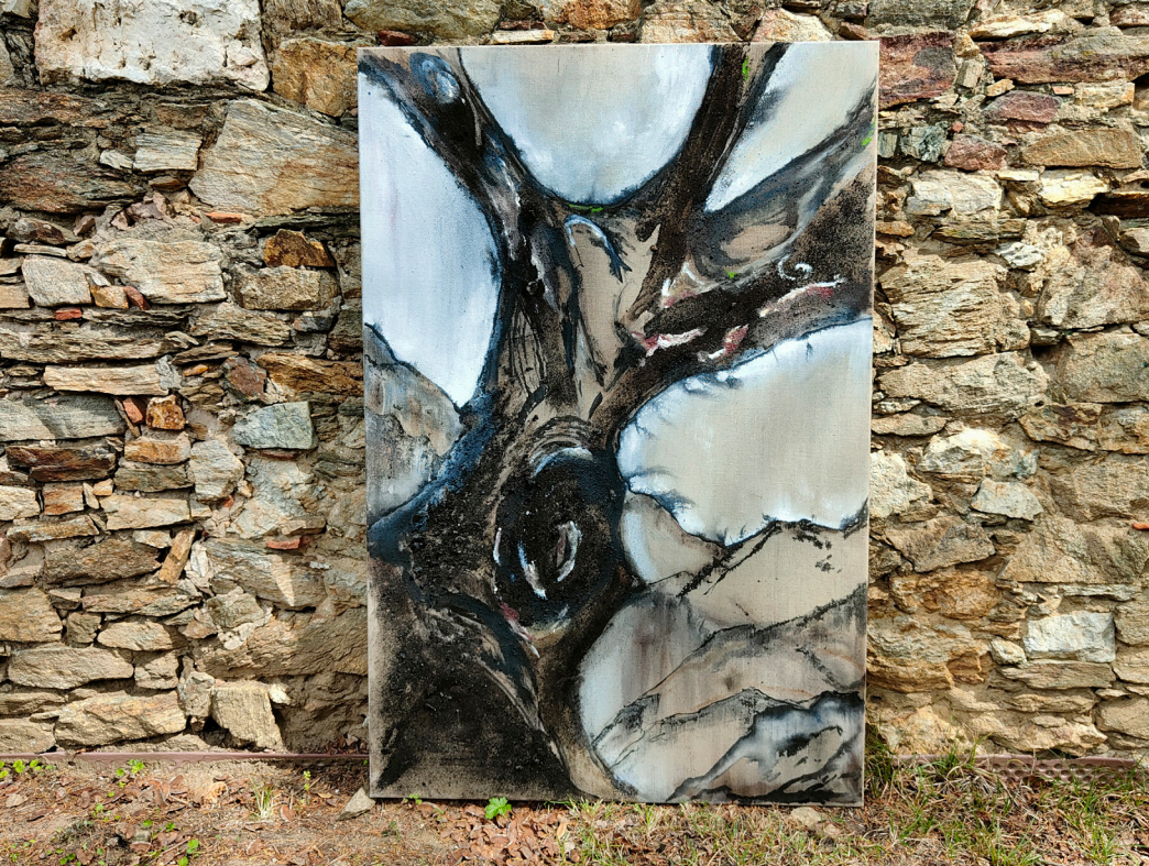
LES NOIRS DE FUMÉE (2022) Peinture à l'huile, bois calcinés