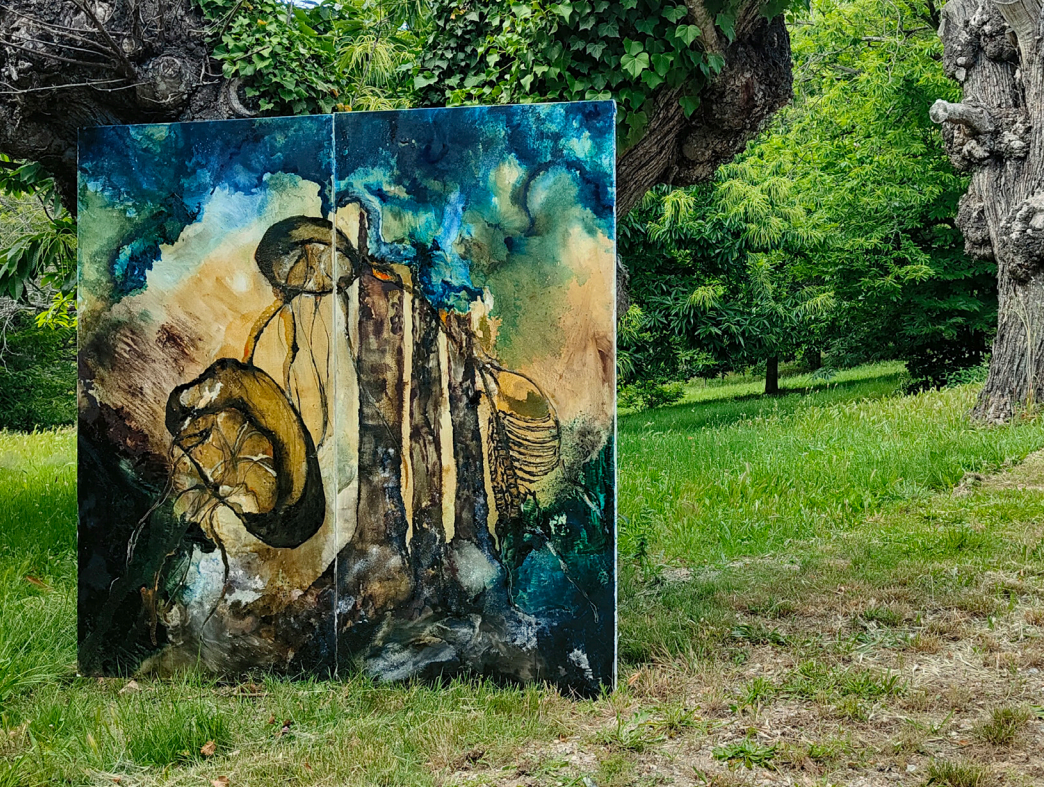
EZECHIEL SOUS LES EAUX (2019) Peinture à l'huile 50 x 70 cm