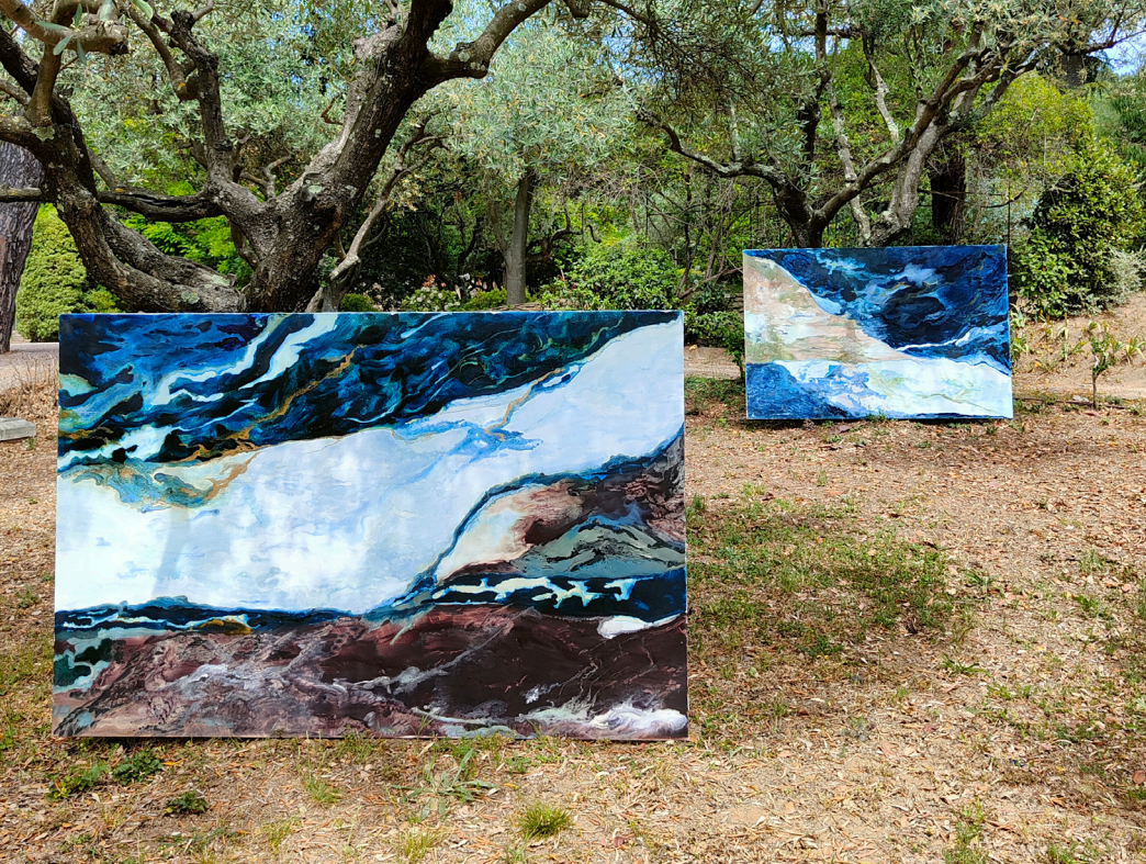
ÉLÉMENT (2020) Peinture à l'huile 1m30 x 1m95