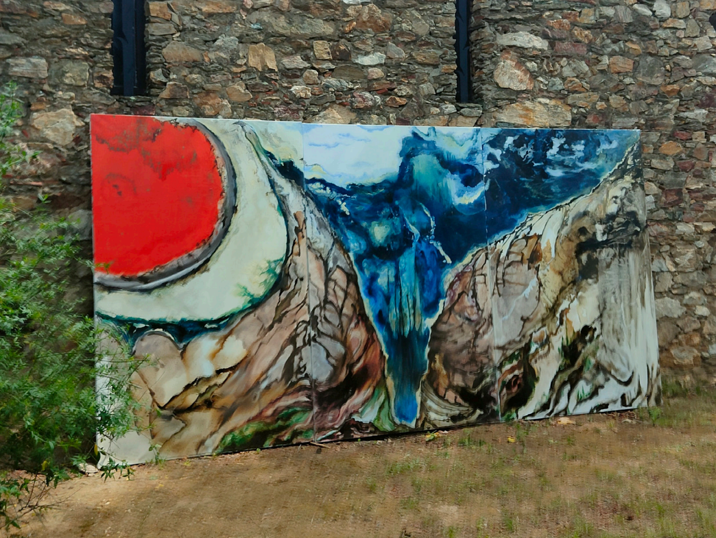
ARGILE I AMÉLIE (2022-2023) Peinture à l'huile, bois calcinés 1m x 3 m