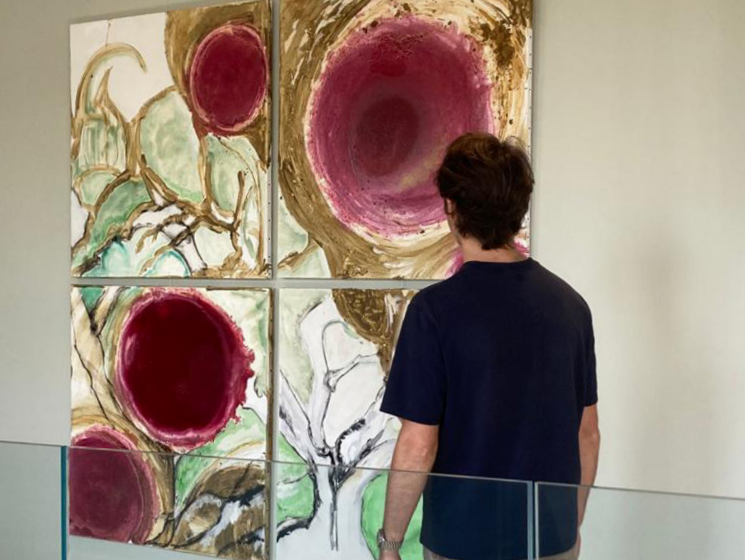
SARMENT D'ARGILE (2023) Peinture à l'huile, vin, argile 1m x 1m (unité)